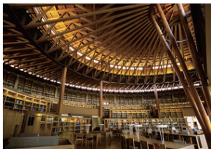
国際教養大学図書館棟

【主な著書】2010 年「構造デザインの歩み」建築技術、2014 年「建築形態と力学的感性」日本建築学会、「構造デザインマップ 東京」総合資格、2016 年「構造ディテール図集」オーム社、2017 年「ヤマダの木構造」エクスナレッジ、2019 年「構造設計を仕事にする」学芸出版社、2020 年「ひとりで学べる中層木造建築 (ラーメン構造等) の構造設計演習帳」日本建築センターほか。