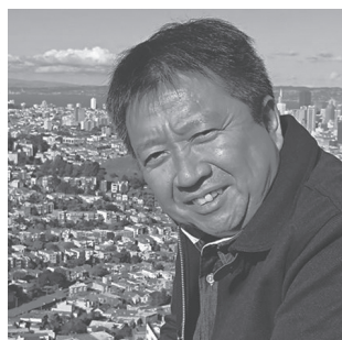
中大規模木造 耐火設計地域リーダー (株)兵庫確認検査機構