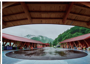
上勝ゼロ・ウェストセンター