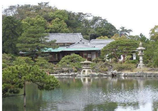
主屋（本館）と潮入式池泉回遊庭園