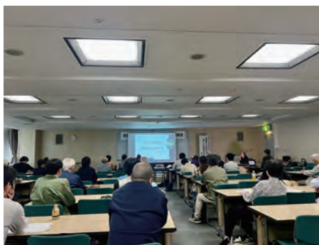
当日の会場の様子

をいただきましたが、実際にオンラインで参加されたのは50名程度と半分程度の参加者数となっています。他方、オンライン開催やその準備には非常にコストや手間がかかっているため、今後もオンラインを併用するのか、開催方法については再検討し、より良い活動に繋げていく予定です。