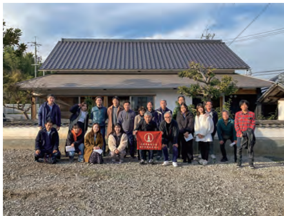
2023年12月9日に開催した建築見学会のときの集合写真

当日はバスに我々と同乗いただき、終日ご案内いただきました。特に「牛窓のヴィラ」では施工中の様子を見せていただき、職人の方からも話をお伺いできました。また、アトリエではご自身の描いた油絵を見ることができ、アーティストとしての一面も知ることができるなど、他にはない充実した見学会となりました。