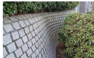
共通外構の御影石