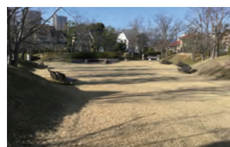
ナチュラルコモン