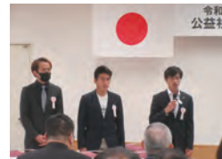
地域貢献活動報告