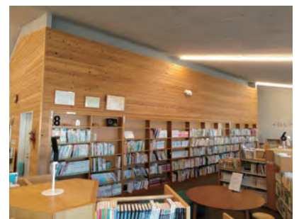
図書館の壁には養父市産の木材が使用されています