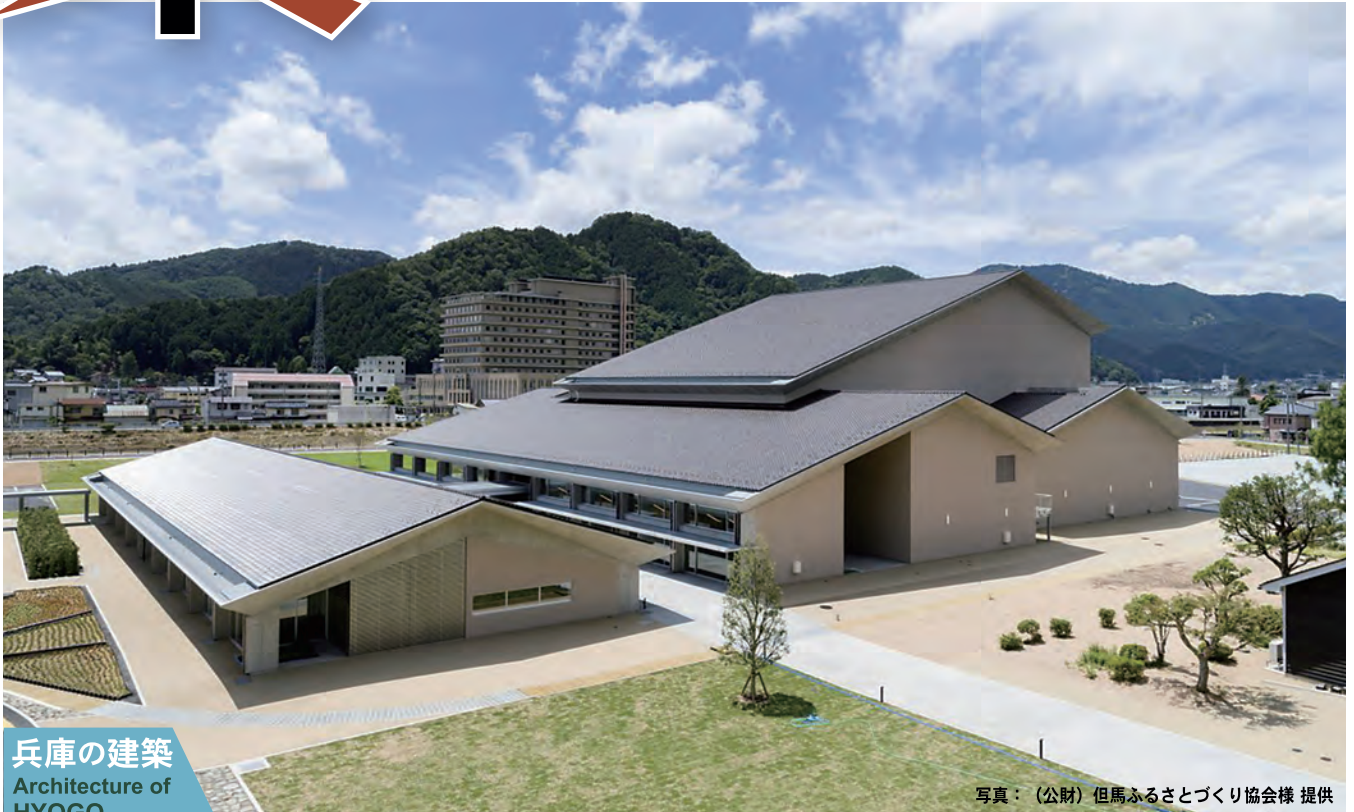
兵庫の建築 Architecture of HYOGO