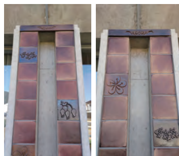
図書館の柱には合併前の旧4町の町花があしらわれています