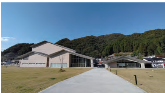
YBファブの横には広い芝生広場があり、市民の憩いの場になっています