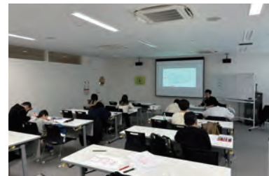
第2回セミナーの風景