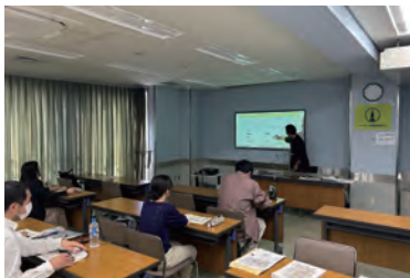
第1回セミナーの風景